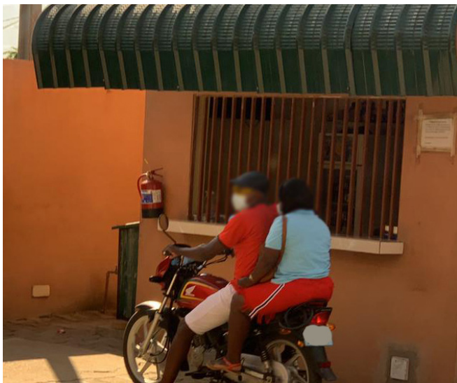
Legenda: “Casal” de guardas prisionais retira-se da pensão pouco antes da saída das reclusas

Passados 3 meses e duas semanas após o primeiro encontro com as reclusas, os pesquisadores do CIP, novamente disfarçados de clientes, decidiram voltar a contactar os guardas prisionais solicitando reclusas para supostamente satisfazerem os seus desejos lascivos. Após dias de negociação foi marcado o encontro para 02 de Abril de 2021, Sexta-Feira Santa, numa pensão localizado há escassos metros do estabelecimento penitenciário. O local foi escolhido pelos guardas.