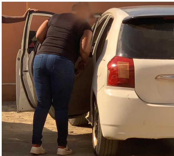
Legenda: Momento em que as reclusas desocupavam a viatura à chegada na Pensão

Por volta das 13:40 chegava à pensão um homem e uma senhora numa motorizada. De longe parecia tratar-se de um casal normal que estava naquela pensão para se divertir. Porém, de normal não tinham nada. Eram, na verdade, dois guardas penitenciários que faziam parte de uma missão de reconhecimento, cuja tarefa era verificar ou monitorar aspectos relacionados com a segurança e inteirar-se de quem eram realmente os supostos clientes. Dez minutos depois chegavam à pensão, numa viatura branca de marca Toyota, as duas reclusas escaladas para a missão: a Maria e a Marta [nomes fictícios], acompanhadas por 2 homens - estes também guardas.