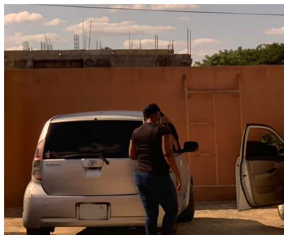
Legenda: Viatura usada pelos guardas prisionais para se deslocar à pensão para vigiar as reclusas