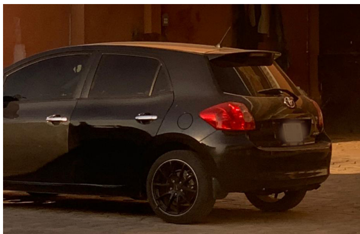
Legenda: Momento em que as reclusas desocupavam a viatura à chegada na Pensão

Mais uma vez, antes da entrega das reclusas, uma missão de reconhecimento foi adiantada para a pousada. Novamente um casal de guardas prisionais, desta vez seguindo em viatura ligeira de marca Toyota, de cor preta. O casal chegou e ocupou um quarto localizado na rés do chão da pensão, em posição que lhe permita manter o controlo da situação.