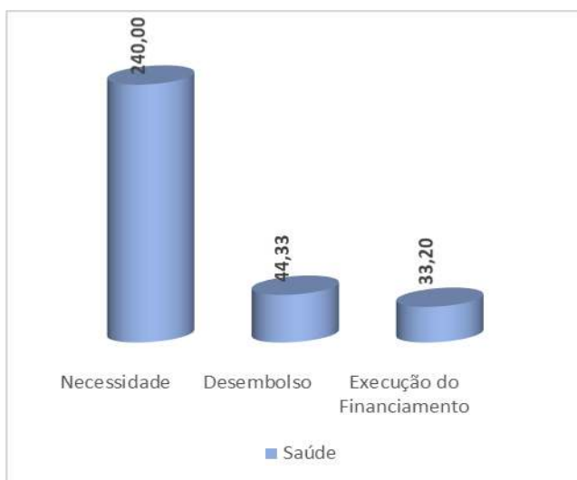
Gráfico 1: Execução do Financiamento para Prevenção e tratamento da COVID (Milhões USD)