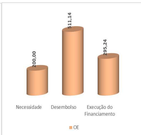
Gráfico 2: Execução do Financiamento de apoio ao orçamento do Estado (Milhões USD)